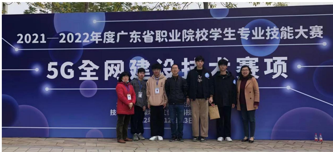
5G 全网建设技术赛项团队