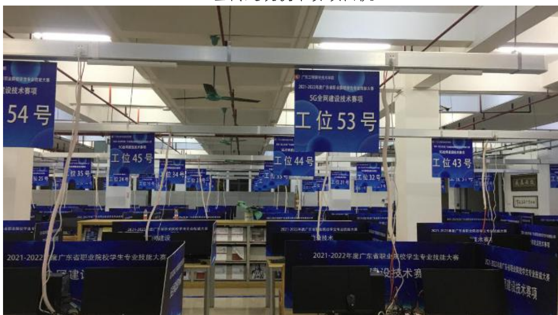
5G 全网建设技术比赛场地