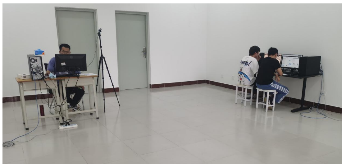
物联网技术应用赛项比赛现场（线上比赛）