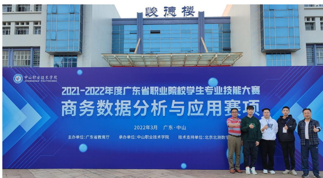
商务数据分析与应用赛项团队