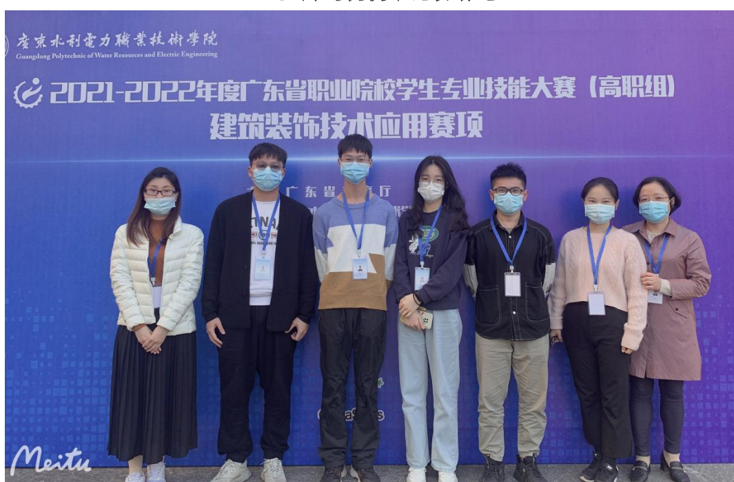
建筑装饰技术应用赛项团队