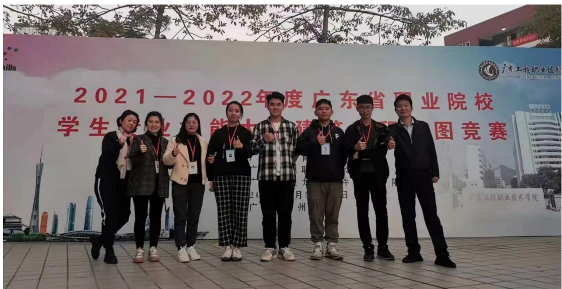
建筑工程识图赛项团队

新的《职业教育法》颁布实施，使职业教育再次迎来发展春天，职业院校学生发展的平台将越来越广阔，工程学子顺应时代发展，抓住机遇，以赛促学，不断夯实专业基础，拓宽视野，加强自身技能锤炼，实现技能成才、技能报国！